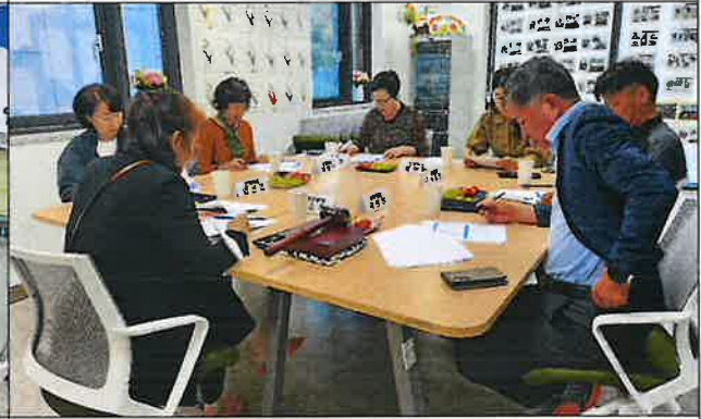
3차 운영위원회 사진