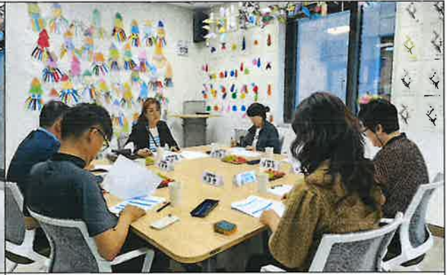
3차 운영위원회 사진