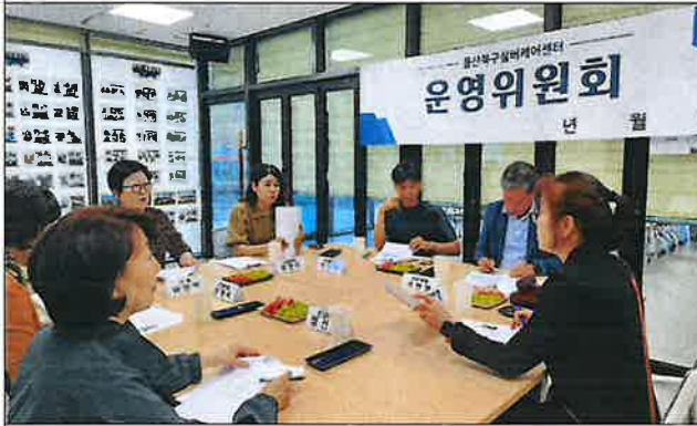
3차 운영위원회 사진