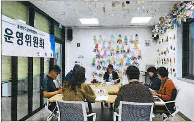
3차 운영위원회 사진