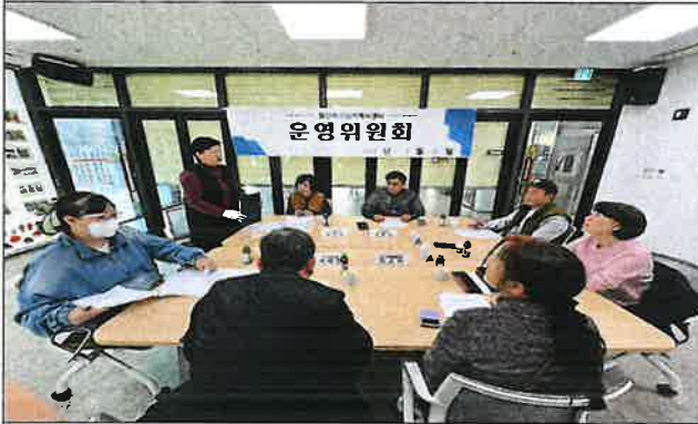
1차 운영위원회 사진