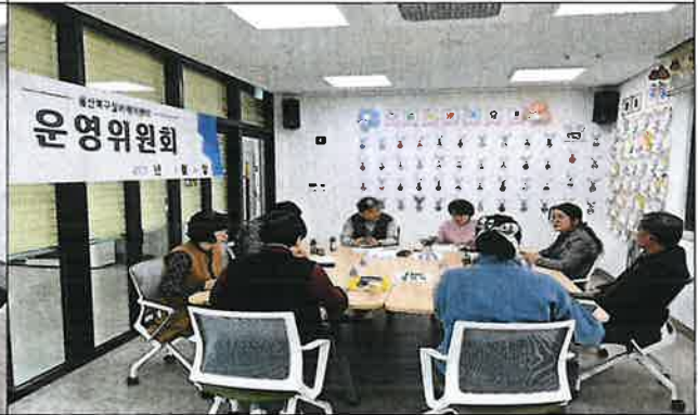
1차 운영위원회 사진