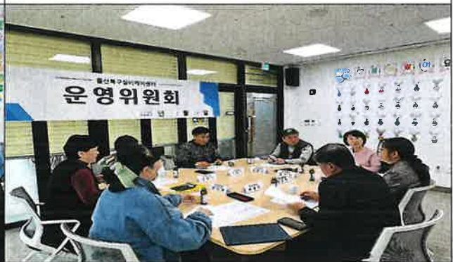
1차 운영위원회 사진