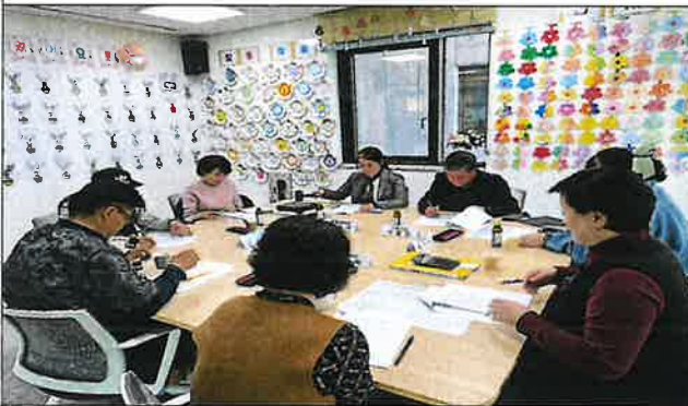
1차 운영위원회 사진