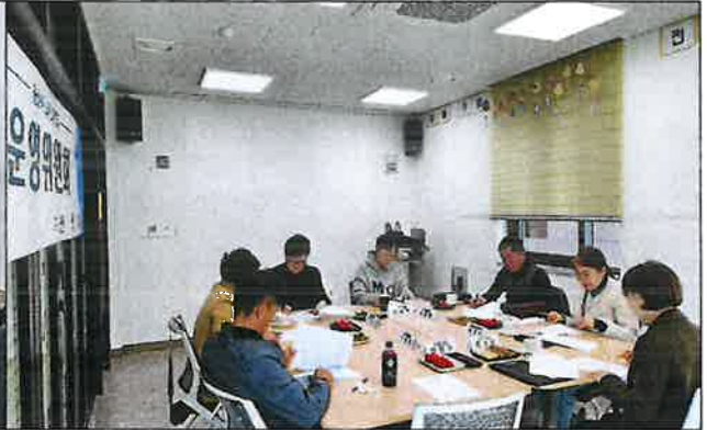
1차 운영위원회 사진