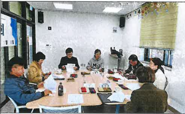
1차 운영위원회 사진