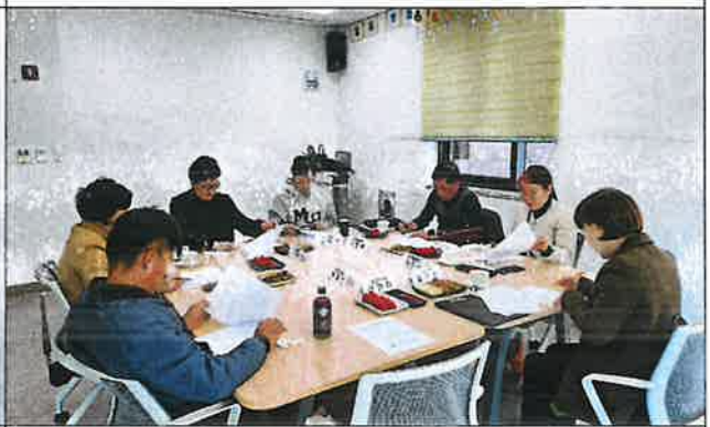
1차 운영위원회 사진