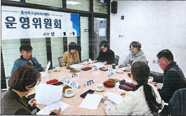
1차 운영위원회 사진